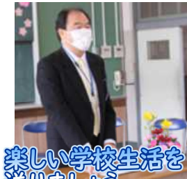
楽しい学校生活を送りたい

今年1年の目標は立てましたか？小さなことでも「できた!」「わかった!」をたくさん経験して、目標の達成を目指したいですね。