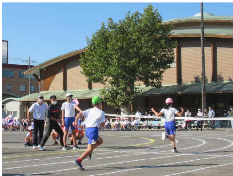
頑張る子どもたちを見守るシンボルツリー（プラタナス）

また、昨年度発足した『地域学校協働本部（チーム大仁小）』ですが、こちらもコロナの影響で十分な活動ができておりません。まずは懸案事項である「登下校における通学路の安全」について、地域と学校が一体となって考えていけたらと思っています。子どもたちにとって、かっこいい「チーム大仁小」になるよう努力してまいります。一緒に頑張っていきましょう。