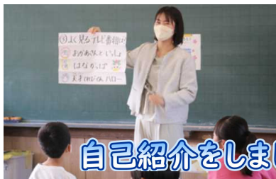
自己紹介をしましょう

わくわく、ときどきの担任発表の後、各教室での学級開きも順調に行われ、よいスタートが切れた新年度となりました。