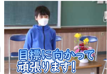
目標に向かって頑張ります!