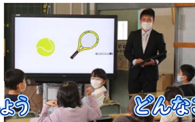
どんなことを勉強するのかな?